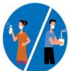
बैताबैतामा साबुनपानीले हात धोउनु

अनुरोधकर्ता : हनुमाननगर कंकालिनी नगर कार्यपालिकाको कार्यालय सप्तरी