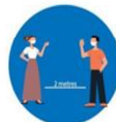
भौतिक दुरी कायम गर्नु